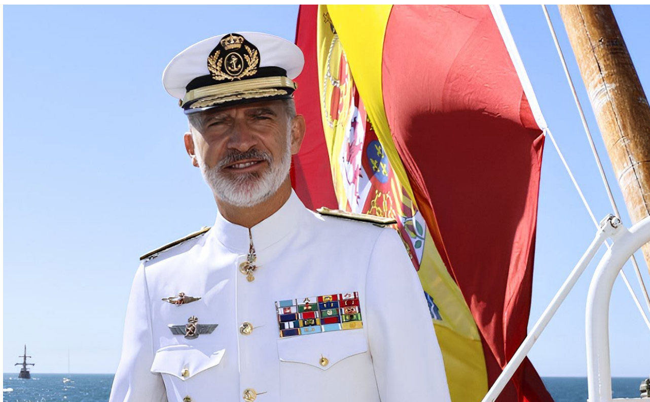
SM EL REY D. FELIPE VI EN EL JUAN SEBASTIÁN DE ELCAÑO

Para la organización de este notable acontecimiento la Armada ha constituido, mediante una orden ministerial, la Comisión de Seguimiento de la Conmemoración del Centenario de la Botadura y Entrega a la Armada del Juan Sebastián de Elcano de la que S.M. el Rey D. Felipe VI es el Presidente de Honor.